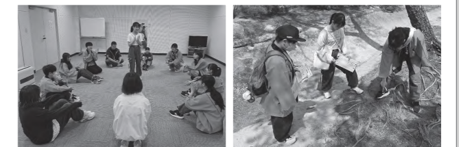
▲ゲームを通じてお互いを知り ▲この根っこはどんなカタチに 見えます!

4月5日・19日にジュニア・リーダー体験会を開催し、4名の中学生が参加してくれました。研修会では現役会員やOB・OGが講師となってジュニア・リーダーの活動内容やゲーム・ダンス等をレクチャーしたほか、雄島をめぐるながら色んな「カタチ」を探すネイチャーゲームや危険予知訓練(KYT)を通じて、子供たちと活動する際に注意すべきことはどんなことか?を考えました。今年度は参加者全員が新規入会し、29名で活動しています!