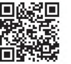
▲申込フォーム 二次元コード

▶申込方法：申込フォームまたはメールに必要事項 (①参加者氏名(ふりがな) ②年齢 ③学校・学年 ④性別 ⑤住所 ⑥電話番号 ⑦当日の緊急連絡先(電話番号)) を記入して申込 ※①～④は参加者全員分を記入してください メール： s.gakusyu@town.matsushima.miyagi.jp