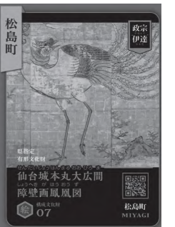
▲構成文化財カード