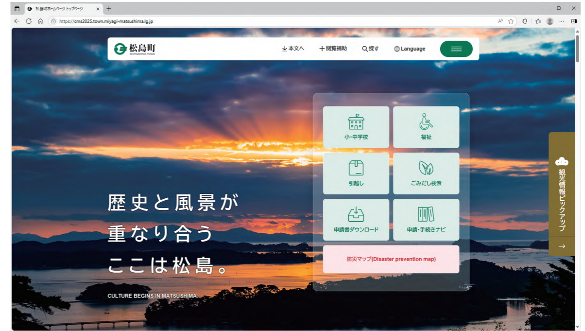
▲リニューアル後のトップページ

町ホームページについて、町民の皆さまにより使いやすく、情報が探しやすいホームページへ生まれ変わることを目的として、5月からデザインや構成をリニューアルしました。 リニューアルのポイントをご紹介します。