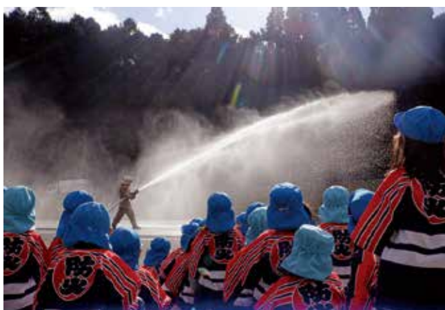
▲消防署員による実放水を見学する児童

生産者からは、「今年は予想を上回る来場者にびっくりした。これからもイベントを通じて松島の美味しいかきをPRしていきたい」と話していました。