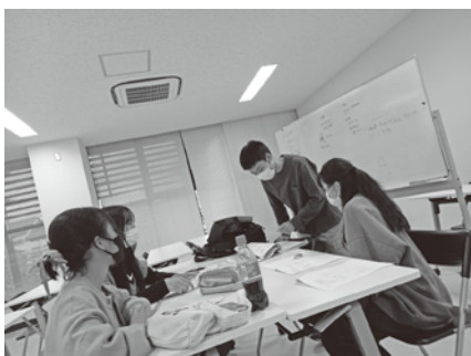
▲中1・中2生でクリスマスパーティーのプログラムを検討中