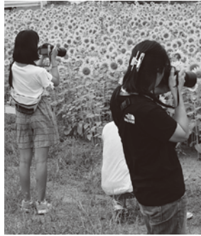
▲9月の写真教室の様子

9月に開催した「キャンノンみんなの笑顔プロジェクト」の2回目。「かき祭り写真教室」を開催します。かき祭り会場や松島海岸の美しい景色を撮影します。キャンノンのスタッフさんから上手に撮影するコツを学びます。親子での参加をお待ちしています。