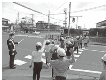
▲交通指導をする様子