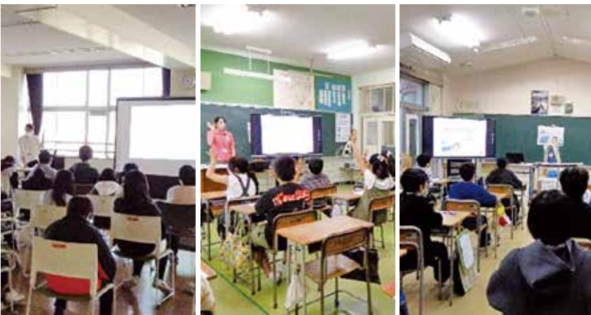
▲認知症サポーター養成講座の様子 (左から松一小、松二小、松五小)

9月から11月にかけて、町内の小学6年生を対象に、高齢者や認知症のある方への理解を深め、思いやりの心を育むことを目的として、認知症サポーター養成講座を開催しました。講座では、平均寿命や高齢化率、認知症の症状や認知症の人との接し方について、認知症キヤラバン・メイトである町職員や認知症地域支援推進員が説明しました。受講した児童の皆さんは高齢者や認知症の人に対して、「優しくしたい」「困っている人がいたら声をかけたい。」等と話していました。