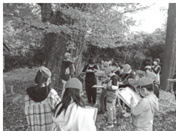
▲一生懸命メモを取りながら見学しました(品井沼干拓学習)