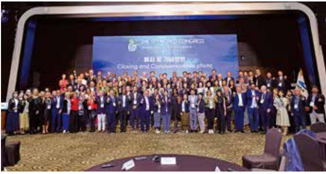
▲世界で最も美しい湾クラブ加盟湾のみなさん

今回の総会で2024年6月5日の世界環境デーにおいて、世界一斉清掃活動を行うことが決定されました。詳細は今後の広報にてお知らせします。