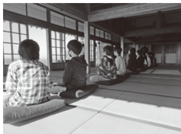
▲絶景を眺めながらの大仰寺坐禅体験

品井沼干拓学習では、元禄ずり出し穴や明治潜穴公園、吉田川・鶴田川サイフォンなど江戸時代・現代にわたる関連遺構・施設を訪れながら、先人たちの苦勞や干拓事業のスケールの大きさに思いを馳せていました。