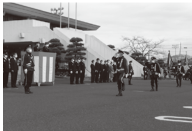
▲昨年実施時の様子