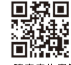
▲確定申告書等作成コーナー

※確定申告書作成会場への入場には「入場整理券」が必要です。入場整理券は、会場でも当日配布しますが、LINEアプリを通じてオンラインによる事前発行も可能です。 ※入場整理券の配布状況に応じて後日の来場をお願ひすることもあります。 ※塩釜税務署内には、確定申告書作成会場を設置しておりません。