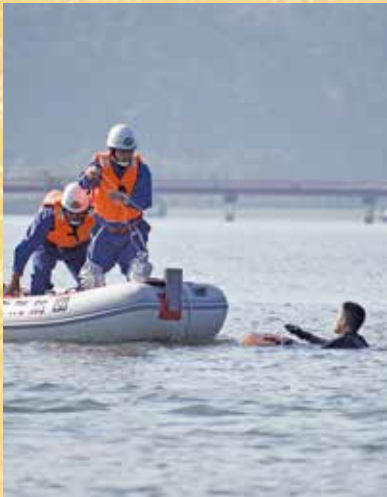
▲総合防災訓練で水難救助を行う様子