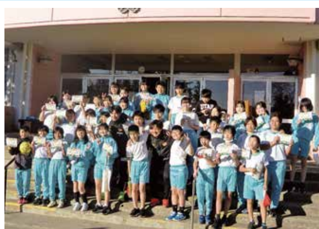
▲第五小学校の生徒たちとの記念撮影

令和5年11月27日に松島第二小学校の6年生が、第43回全日本実業団対抗女子駅伝大会(クイーンズ駅伝)に出場したニトリ女子ランニングチームによる陸上教室に参加しました。児童達はランニングの正しい姿勢や手足の使い方のポイントを教えてもらい、学んだことを活かして実践していました。走ることを楽しみながら短距離走や鬼ごっこをする様子が見られました。