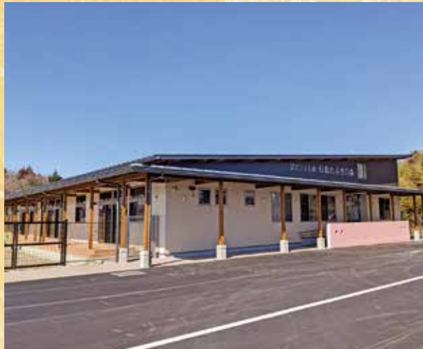
▲令和5年4月に開園した認定こども園松島めぶきの森