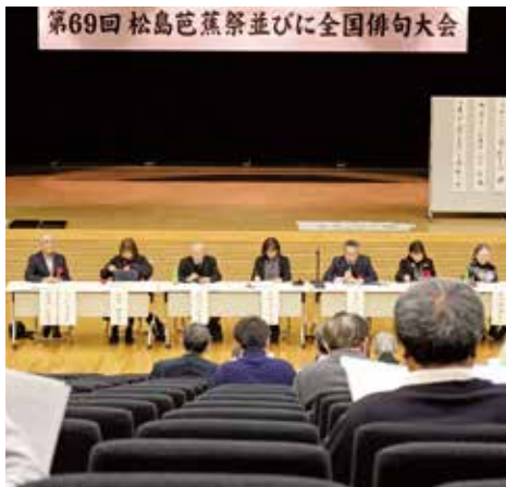
▲文化観光交流館で行われた「全国俳句大会」