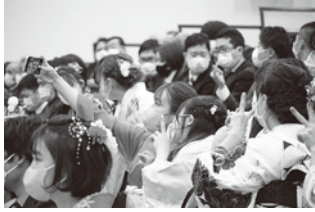
▲昨年実施時の様子