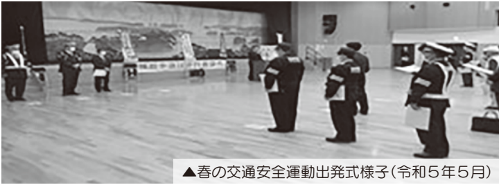
▲春の交通安全運動出発式様子(令和5年5月)