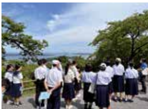
▲西行戻しの松公園を見学している様子