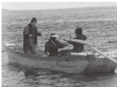
合木舟（南三陸町のもの。「宮城県の文化財」より）

（参考文献：松島町史編纂委員会編『松島町史 通史編一』（1991年）、仙台市史編さん委員会編『仙台市史 年表・索引』（2015年）、宮城県教育委員会編『宮城県の文化財 無形文化財・民俗文化財・保存技術編』（2021年）、小学館『日本国語大辞典 第2版』）