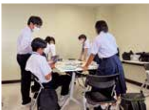
▲グループワークの様子

8月1日と2日に秋田県にかほ市と中学生リーダー研修会が開催されました。研修では西行戻しの松公園や比翼塚を見学し、松島と象潟の関わりを学びました。また、にかほ市の中学生達とグループワークでは、夫婦町の観光名所や特産品をPRし、お互いの市町の特徴を学びました。生徒からも「お互いの市町のいいところを知ることができ、色んな人と仲良くなれて楽しかった。」との声が多く挙げられました。