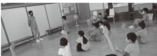
▲初原分館お楽しみ会派遣の様子