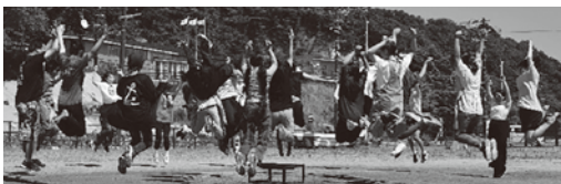
▲合同キャンプは暑さも吹き飛ばす楽しさ！