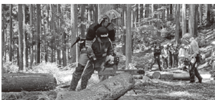
▲森林学習では、チェーンソー体験も行いました！