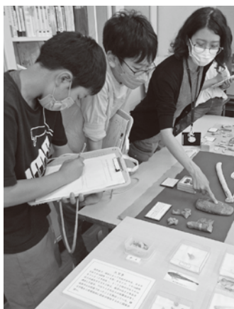
▲出土品を間近に見て、触って、スケッチをしています