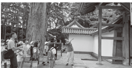
▲学芸員の説明を聞きながら、じっくり見学しました

また、5年生では「森林学習」として、壇山で自然に触れながら林業について学びました。2学期の「まる学」では6年生は座禅体験や歴史巡り、4年生は品井沼干拓学習を行う予定です。