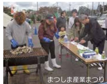
まつしま産業まつり