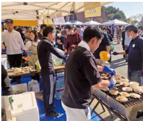
▲かきやホタテを販売する様子

10月17日に、令和5年度宮城県巡回小劇場を文化観光交流館で開催しました。この事業は音楽や演劇の鑑賞を通して芸術文化に触れてもらうことを目的に、町内全小学校の4・5年生を対象に毎年実施しています。