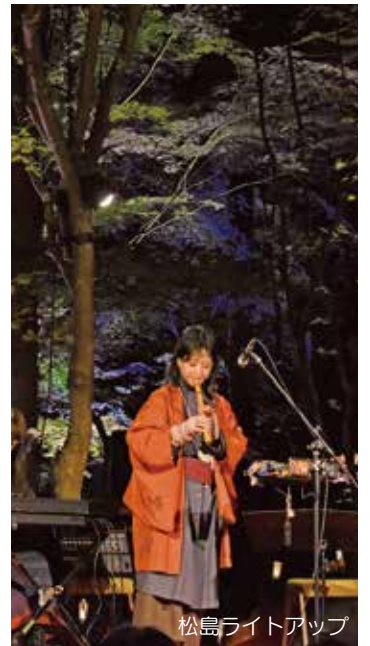
松島ライトアップ