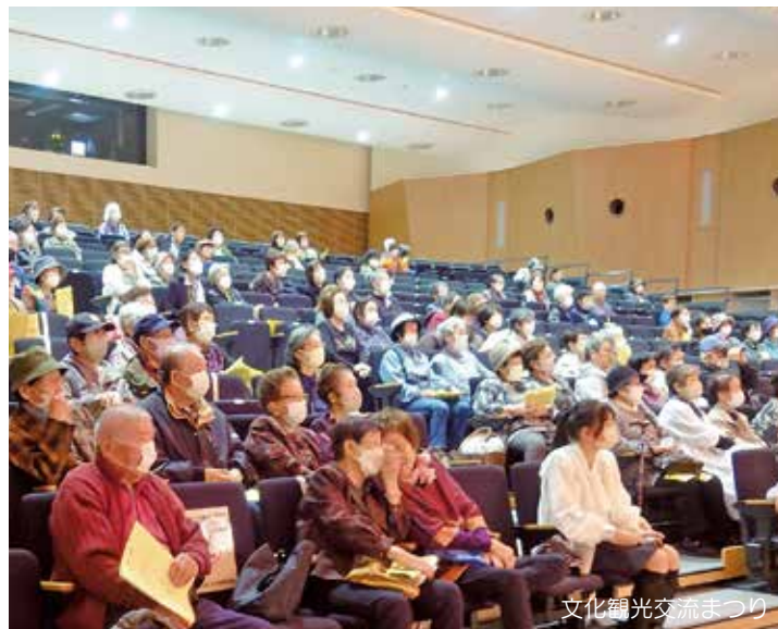
文化観光交流まつり