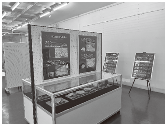
▲松島会場の展示の様子