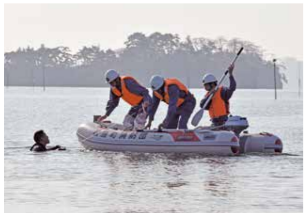
▲水難救助訓練の様子

11月3日に磯島で防災訓練が実施されました。 各種被害状況を想定し松島消防署や自衛隊、塩釜警察署など関係機関と連携した訓練の他、水難救助訓練を始めとした消防団による倒壊家屋等救助訓練、二次被害防止訓練を実施しました。 また、松島町婦人防火クラブによる水パケツでの初期消火訓練や災害協定を締結している各事業者の他、防災用品を取り扱っている事業者から防災関連事業の展示がありました。