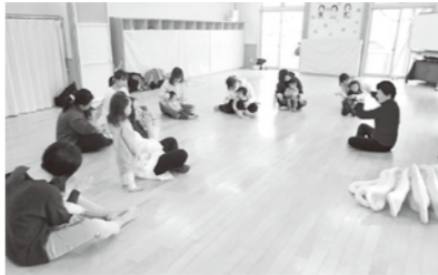
▲ディスカッションイメージ