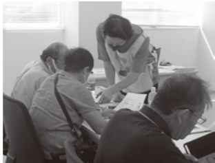
▲スマートフォン教室を 実際に受けている様子