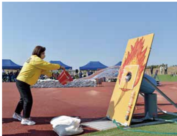
▲初期消火訓練の様子