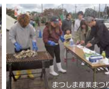
まつしま産業まつり