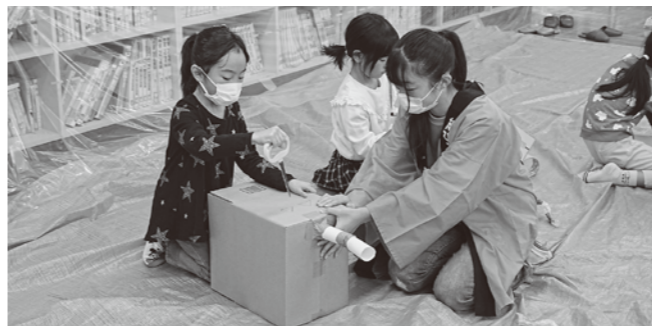
▲子供たちの自主性を尊重しながら、危険がないよう見守りました

10月～11月、「紙ひこうき」はぐくみ隊のお手伝いに参加しました。この事業は小学校低学年向けの創作教室で、今年度で22年目を迎えます。今回協力したジュニア・リーダーの中には、小学生の時に参加していた「はぐくみ隊卒業生」もあり、学びの循環を感じられる取組となりました。今回参加してくれた小学生の中にも、将来ジュニア・リーダーとして活躍してくれる子がいるかもしれません。また、10月29日には松島町児童館の「ハロウィンまつり」に参加し、子供たちと一緒に仮装して町内ウォークラリーを行いました。ジュニア・リーダーの活動や派遣に関する問合せ 教育課生涯学習班 ☎354-5714