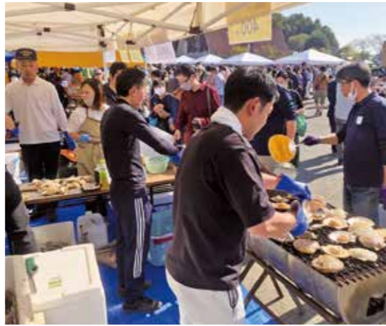
▲かきやホタテを販売する様子