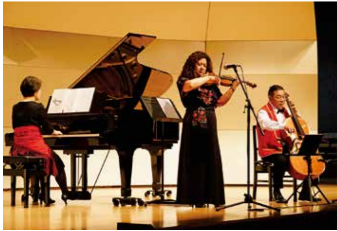
▲迫力ある生演奏に、子どもたちも真剣に鑑賞していました