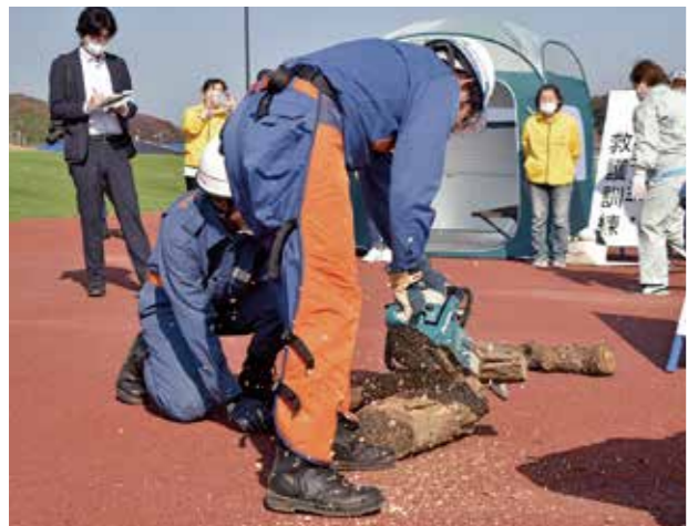
▲倒壊家屋等救助訓練の様子

10月17日に、令和5年度宮城県巡回小劇場を文化観光交流館で開催しました。この事業は音楽や演劇の鑑賞を通して芸術文化に触れてもらうことを目的に、町内全小学校の4・5年生を対象に毎年実施しています。 今年度は「ハンガリーの風コンサート」と題して、ヴァイオリンとチェロ、ピアノの演奏を鑑賞し、普段ふれる機会の少ない東欧の楽曲を楽しむことができました。公演の中ではヴァイオリン奏者が客席の通路で演奏してくれる場面もあり、子どもたちは身を乗り出して鑑賞していました。