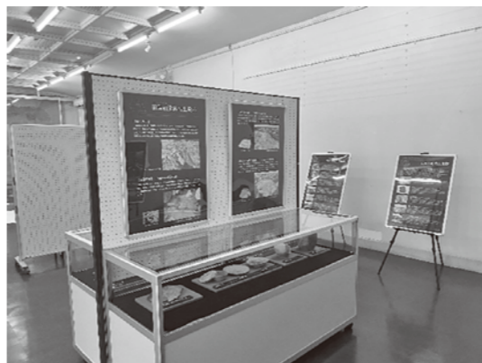
▲松島会場の展示の様子