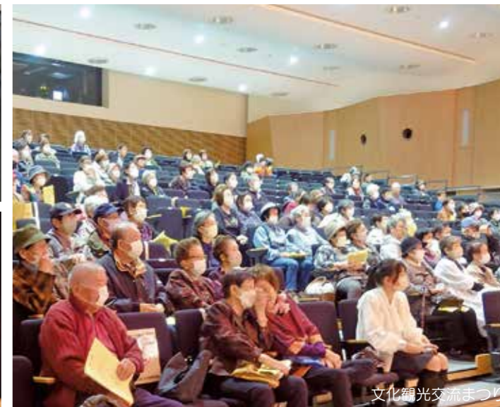
文化観光交流まつり