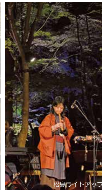
松島ライトアップ