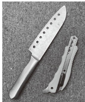
▲実際に混入していた危険物