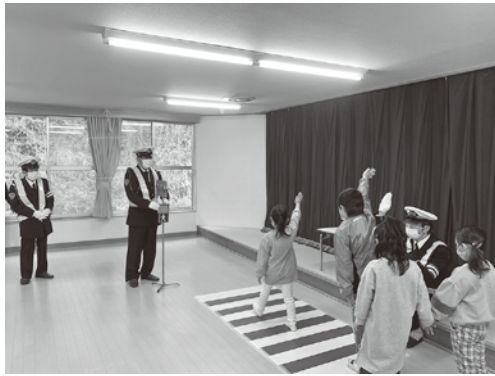
▲松島第一幼稚園交通安全教室の様子