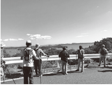
▲ノルディックウォーキング教室の様子