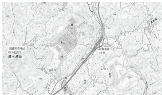
▲国土地理院地図より