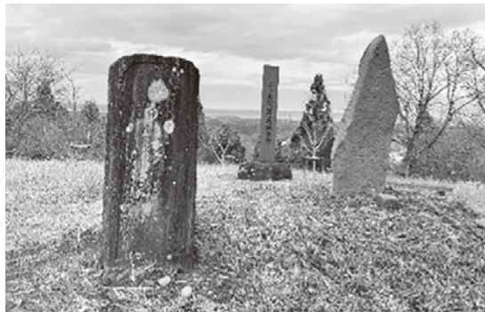
▲向かって左が今回紹介する石碑