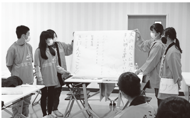
▲KYT(危険予知トレーニング)を行い、活動に応じた注意点についてみんなで考えました