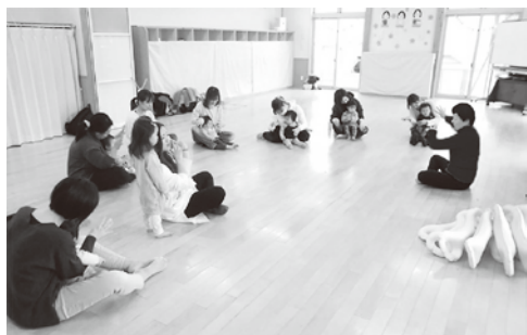
▲ディスカッションイメージ