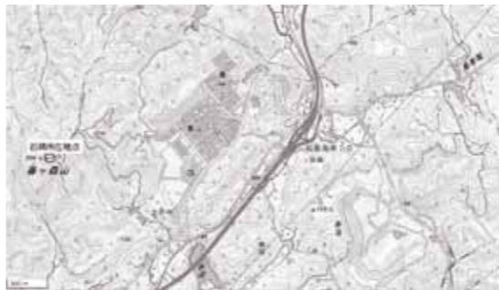
▲国土地理院地図より