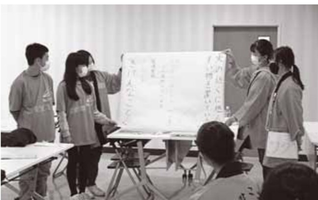
▲KYT(危険予知トレーニング)を行い、活動に応じた注意点についてみんなで考えました