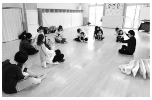
▲ディスカッションイメージ

本町では、町の将来を皆さんと気軽に話せる場としてタウンミーティングを開催します。子育て世代のお母さん方をはじめ、町内で活動している各種団体やサークル、行政地区など、幅広い世代や多くの方々や町と一緒に考えながら、町長と直接話し合ってみてほしいと考えている方々を募集しています。「松島町をもっと盛り上げたい」、「将来、松島町でこんなことをしたい」など、皆さんの考えや想いをぜひお聞かせください。この記事を読んで興味を持たれた方は左記までお問い合わせください。（町政に対する苦情や要望等は除く。）