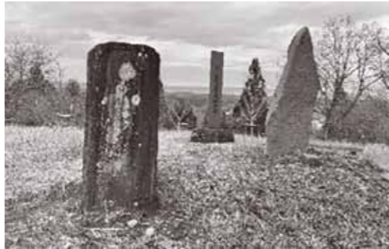
▲向かって左が今回紹介する石碑