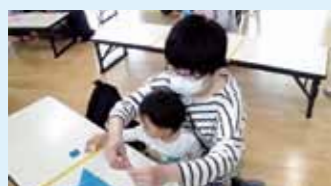
お母さんと一緒に “こいのぼり”を作りました！