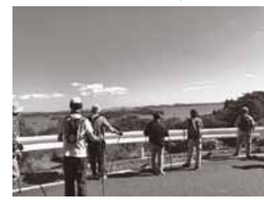
▲ノルディックウォーキング教室の様子