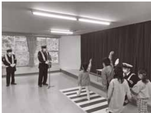
▲松島第一幼稚園交通安全教室のようす