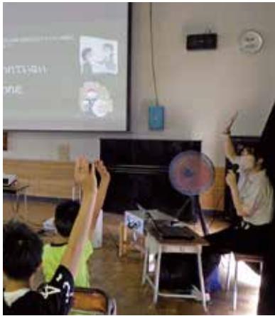
▲クイズ形式で税について学ぶ様子