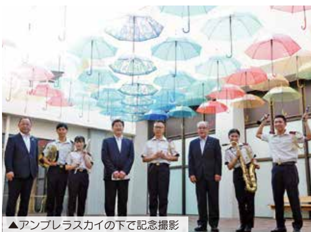
▲アンブレラスカイの下で記念撮影