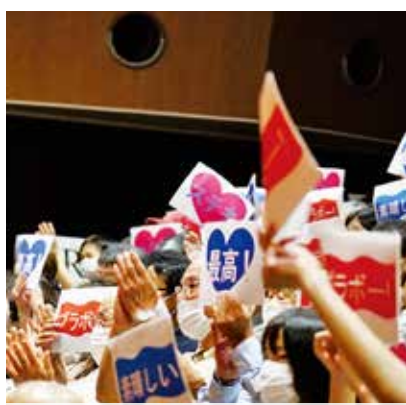
▲歓声に替えて「ブラボー！」や「最高！」などのメッセージで応援