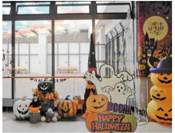
▲ハロウィンとアンブレラスカイの共演（10日まで）