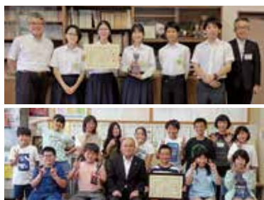
▶松島中学校生徒会の表彰写真 ▶松島一小企画委員会の表彰写真

第8回みやぎ小・中学生いじめ防止動画コンクール(県教委主催)が開催され、松島中学校及び松島第一小学校が優秀賞を受賞しました。優秀賞の作品は、民放地上波のテレビCMなどで放送される予定です。