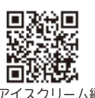
▲アイスクリーム編