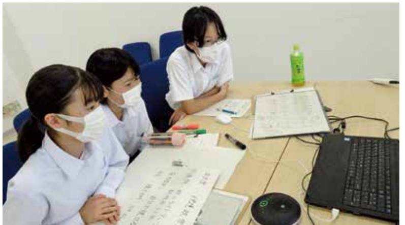
▲秋田町にかほ市とオンラインで交流している様子

授業では、自分たちの身の回りでのように税金が使われているのかといったことや、その決め方や集め方について、クイズ形式やアニメーションを交えながら講師となった町職員の説明を受け、楽しく学びました。 授業の最後には、各児童が1億円のレプリカを実際に持ち上げ、その10キログラムの重さに驚いていました。