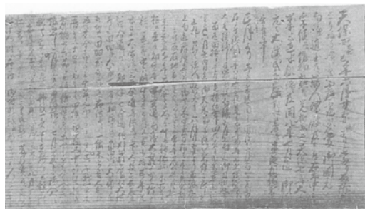
真野家文書「天保飢饉の記録」