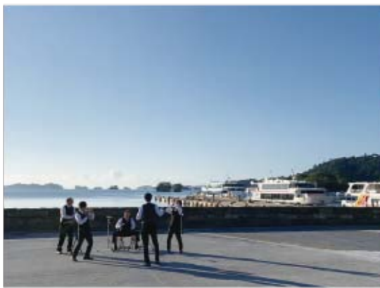
▲松島湾を背に親父バンドが美味しい音楽を奏でます(CMの1シーン)