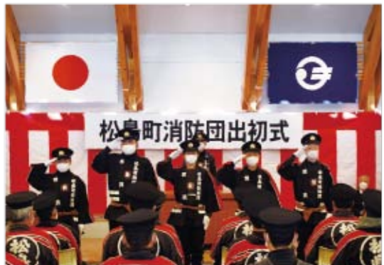
▲新しく入団された皆さん