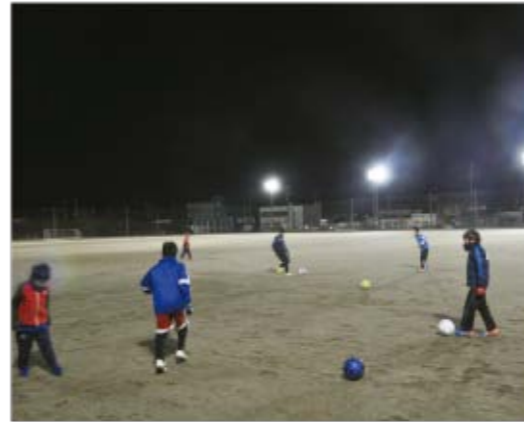
▲LED化で明るくなった町民グラウンドの様子

今回の工事は「JFAサッカー施設整備助成事業」を活用して、水銀灯照明をLED照明へ更新したものです。照度が向上したことにより、夜間でもより快適にスポーツに取り組むことができるようになりました。町内のスポーツ団体の皆さんが、さっそく照明の下でボールの見え方などを確かめていました。