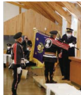
▲消防長官表彰旗の伝達