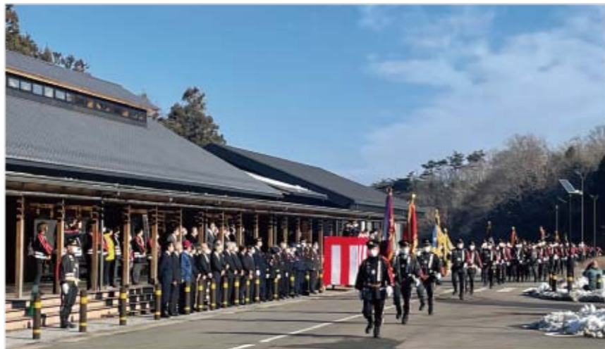
▲多くの観閲者を前に行進する団員の皆さん

1月10日、石田沢防災センターで松島町消防団出初式が行われました。消防関係者の方々を前に「纏」を先頭に第1分団から第6分団までの団員が一糸乱れぬ見事な行進を披露しました。全国的に大規模火災が増えている中、団員