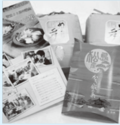
▲地産地消費の賞品