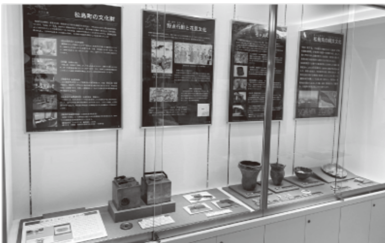
▲「リフノス」での展示の様子

寒さ厳しい季節ですが、今回ご紹介するのは「お花見」のお供、野点行厨・野井当セツトの中の一つです。その名の通り、熱燗を外で飲むときに使われた道具であると考えられます。伊達家の家紋の一つである九曜文を透かし飾りとして使用するなど華やかな意匠で、大名や上級武士とその家族が使用したものでしょう。「松島湾3町文化財展」として利府町文化交流センター「リフノス」(利府町森郷字新椎の木前31の1)で2月15日まで展示していますので、ぜひご覧ください。(開館時間：午前9時～午後9時)