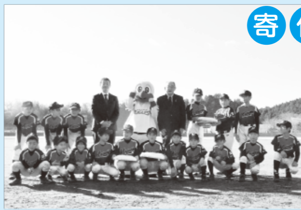
▲イーグルスのロゴ入りベースをいただきました