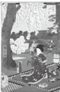
歌川広重・歌川豊国「江戸自慢三十六興 東叡山花さかり」