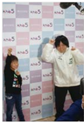
▲代表して2人がステージで松島をPRしてくれました!