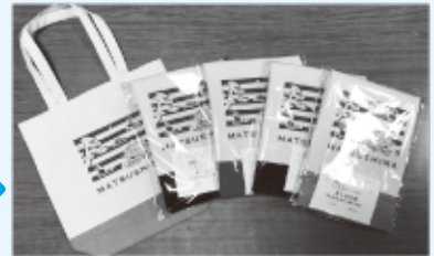
▲健康ポイント事業の記念品は松島町のロゴ入りトートバッグです!