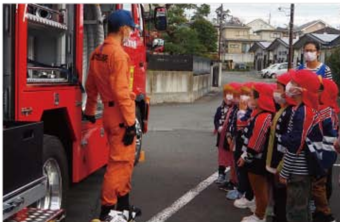
▲消防車のしくみを学びました

子どもたちにとって、実際に消防車両を見ることができ、防火や防災に対する理解を深めることができた1日となりました。