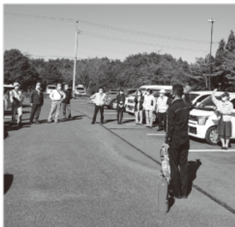
▲説明を受けてから訓練開始

ボイラーからの出火を想定 周辺施設合同で訓練 10月14日午後、松島町保健福祉センターどんぐりで、秋の消防訓練（総合訓練）を実施しました。 訓練は、保健福祉センターボイラー室が出火元の想定で実施し、近隣の施設の職員・利用者や一般の方も参加し、合同で避難経路を確認しあい、消火器の使用方法や救急救命の研修を行いました。