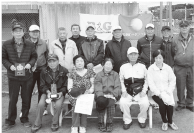
▲ペタンク大会参加者の皆さん