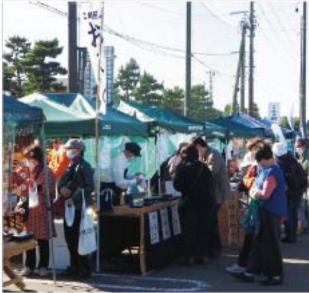
▲たいへん賑わった「まつしま産業まつり」

今年は大元経済団体、町内の農林・水産・商工関係者、合わせて16の出店で、好天の中、それぞれに趣向を凝らしたブースに開店前から大勢の方が詰めかけ、「松島五大大堂太鼓や松島祭連竹谷舞「雀踊り」が会場を盛り上げていました。会場入口では新型コロナウイルス感染症拡大防止を呼びかけるなど、対策もしっかりと図った中での開催となりました。