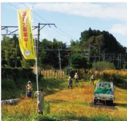
▲環境美化が図られました

10月23日、町のシルバー人材センター会員で幡谷、竹谷、北小泉地区の有志の方々が、地域で利用するJR品井沼駅周辺の草刈りなどの環境整備を行いました。平成12年から実施しており今年で22回目となるこの活動ですが、朝から会員のみなさんは、作業車両と草刈り機、草取り用カッターなどを持ち込み、ホーム脇や駐車場周囲などの背丈ほどに伸びた雑草を丁寧に刈り取り、駅周辺の美化を図りました。新型コロナウイルス感染症拡大防止を図るため、マスク着用と作業間隔を開けての作業となりました。