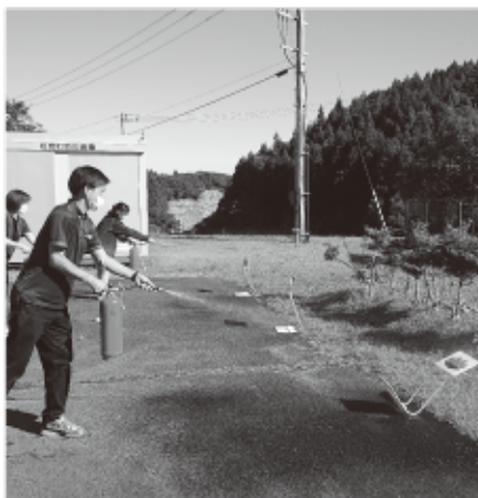
▲初期消火訓練の様子

●問合せ先 新型コロナウイルスワクチン接種対策室 ☎355-0667 松島町根廻字上山王6-27