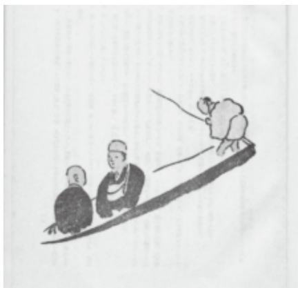
雄島に渡る芭蕉と曾良 『奥の細道古註』