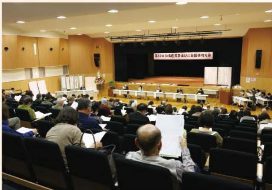
▲文化観光交流館で行われた「全国俳句大会」

昨年の『全国俳句大会』は、コロナ禍の影響から紙上での開催となりましたが、今年は2年ぶりに松島町文化観光交流館での開催となりました。