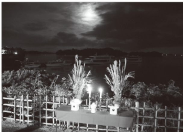
▲昨年の観瀾亭からの「中秋の名月」