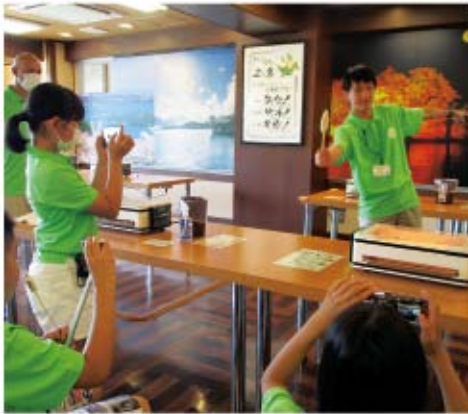
▲わかりやすいジェスチャーで松島の魅力を表現します