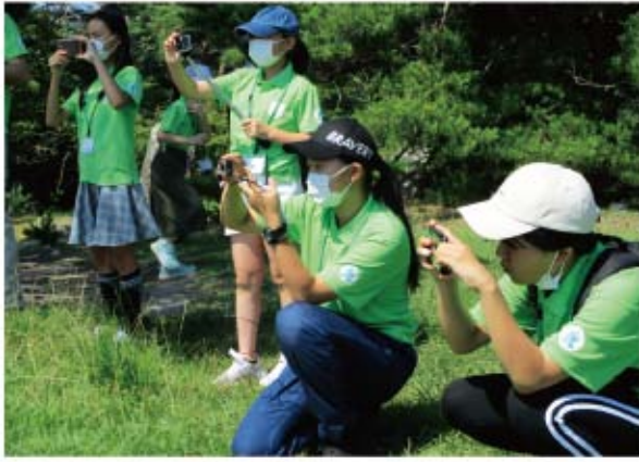
▲子ども達が自らカメラマンになりました