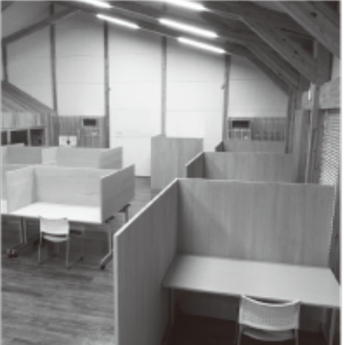
▲9月1日オープン予定です