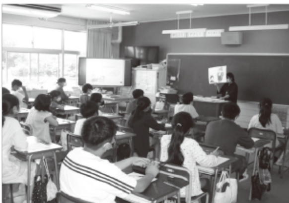
▲認知症サポーター養成講座の様子

●問合せ 新型コロナウイルスワクチン接種対策室 ☎355-0667 松島町根廻字上山王6-27