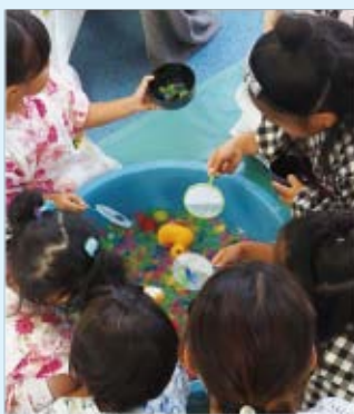
▲金魚すくいコーナーは大人気