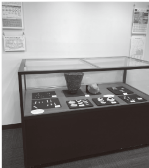
▲観光インフォメーションルームで展示中です