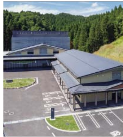
▲利府町森郷に完成した「塩釜地区りふ斎苑」

・塩釜地区りふ斎苑 ☎3533-7571 利府町森郷字名古曾87番地20（午前8時30分～午後5時15分）