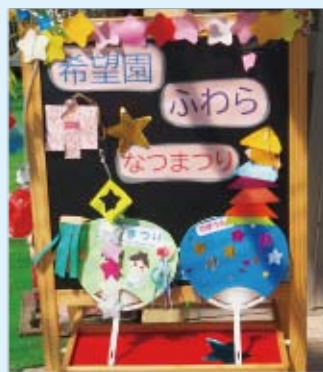
▲すてきな「かんぱんアート」も作りました