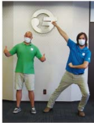
▲ALTの先生が指導にあたりました

今年度は新型コロナウイルス感染症拡大防止の観点から内容を変更して実施しました。コロナ禍が収束した後、多くの外国人観光客に松島に来てもらえるような動画を作成し、世界に向けて発信します。完成した動画については広報まつしま10月号で紹介します。