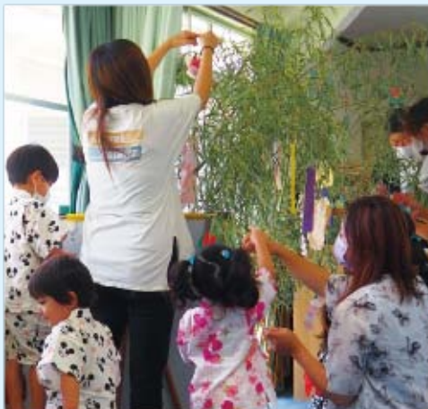
▲みんなで願いをこめて飾りました

手遊びやペンギンのプール体操、ふわらさんのハンドベル演奏を聞き、きらきら星やたなばたさまをみんなで歌いました。