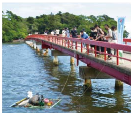
▲アマモ場再生活動を実施しました

感染症対策を徹底しながら、福浦橋を訪れた多くの観光客の皆さんに協力頂き、砂団子1500個を海に投げ入れました。