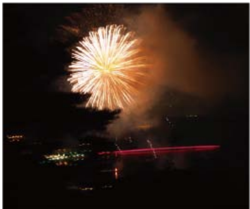
▲供養花火が夜空を彩りました

8月12日から新型コロナウイルス感染症の感染拡大により宮城県・仙台市の緊急事態宣言が発表されたこともあり、町内のイベントがほとんど中止となる中、例年とはちがった静かな夏の夜空を彩る花火となりました。