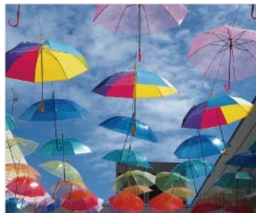
▲青空に色あざやかなパラソルが浮かぶ

今年も9月30日まで開催しており、9月18日(土)には「アンブレラスカイイベントライブ」も開催されます。天気の良い日は青空に映えてとても美しいので、ぜひ訪れてみてはいかがでしょうか。