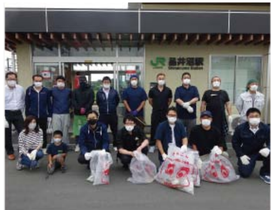
▲参加された青年部のみなさん

今年は青年部員と家族あわせて17名が参加し、品井沼駅や第五小学校周辺の歩道などのゴミを拾い集め、街をきれいにしました。