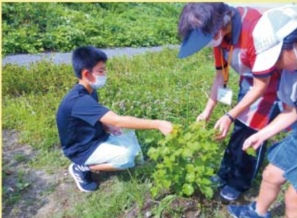
児童館の建物の裏に、夏野菜を少し植えていました。立派に育ちました。