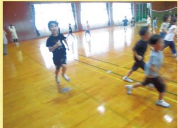
B&G体育館で運動遊び。天気が悪くても、体を沢山動かせました！