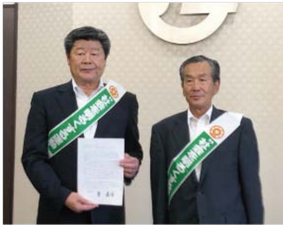
▲濱田代表から伝達されました

例年7月は「社会を明るくする運動強調月間」として、関係団体や学校などと連携し、街頭でのPR活動などを実施していますが、新型コロナウイルス感染症が拡大する中、今年度は活動を自粛しています。