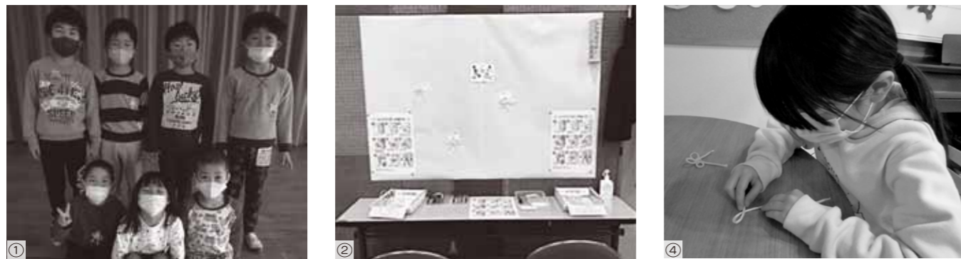
①_シトラスリボンをみんなで着けてみました♪(町立保育所) ②_展示会にシトラスリボン制作コーナーができました。(品井沼笑(絵)手紙展示会) ④_みんなでシトラスリボンづくりをしました。上手にできたかな?(児童館)

新型コロナウイルスに感染した方やそのご家族、医療従事者の方々に対する差別行為や誹謗中傷をなくし、みんなが思いやりの心を持って支え合う地域づくりを目指して愛媛県の有志がつくったプロジェクトで、愛媛特産の柑橘にちなみ、シトラス色（黄色・黄緑など）のリボンやロゴマークを身につけて、「ただいま」「おかえり」の気持ちを表す活動です。