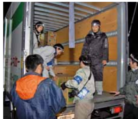
様々な自治体から給水のご支援いただきました 兵庫県のボランティアの皆さんによる炊き出し にかほ市の皆さんに多くの物資をご支援いただきました