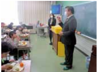
櫻井町長も給食の様子を見学しました