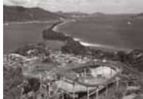
▶天橋立ビューランド

Q. 最後に町民の皆さんへ一言お願いします。 A. 今、私達にできることは不要不急の外出を控え一刻も早く新型コロナウイルス感染症の終息を願うことです。終息した際には日本三景が日本全国のみならず世界を元気づけるために頑張っていきたいと思っています。