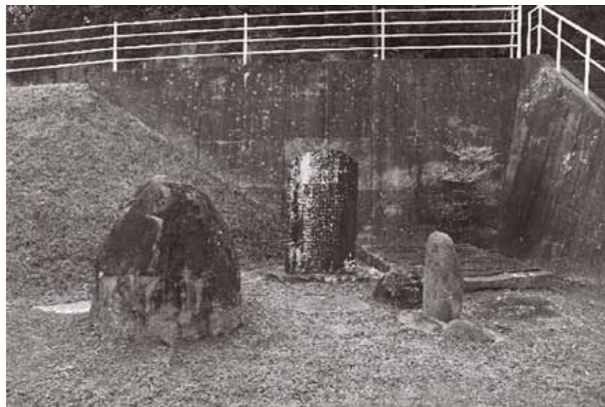
▲写真2：庭園整備を記念する石碑