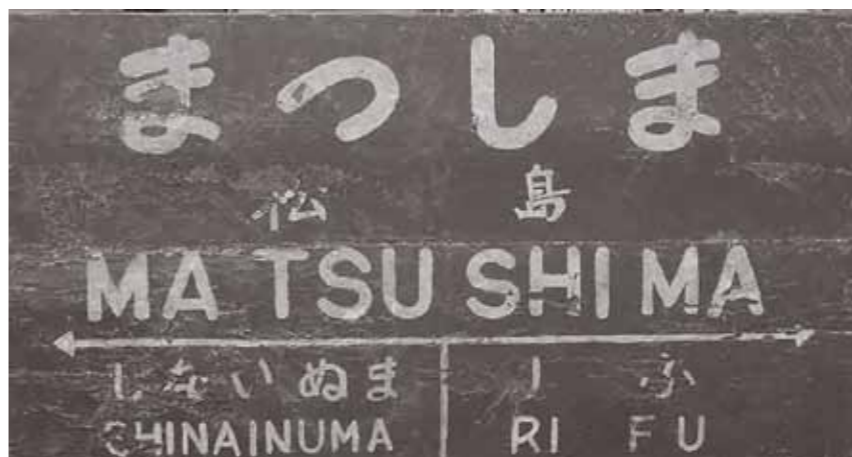
▲写真1：旧松島駅名標