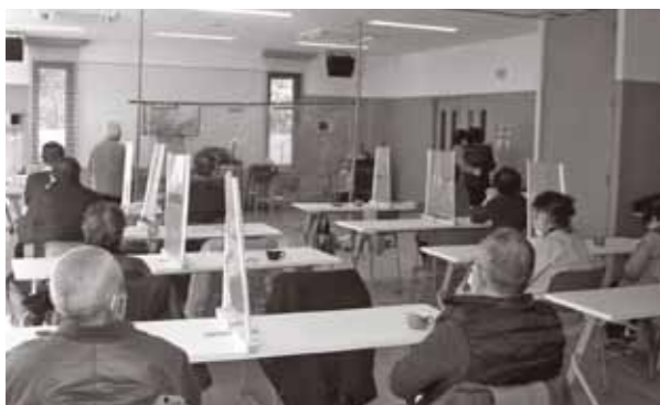
▲手作りビニールカーテンの奥で背中を向けて歌う写真

機崎地区の高齢者の通いの場「健寿会」では、感染症対策を実施しながら、カラオケやお茶会の活動を続けています。飛沫対策として、各席にパーティションを設置し、カラオケを歌う時は、カラオケブースを使用しています。「コロナ禍でも高齢者の介護予防と健康のために、できる限り活動を継続したい」という参加者の意向から、感染対策の話し合いを重ね、パーティション、カラオケブースを手作りしたそうです。参加者は笑顔で「とっても楽しい」と話していました。