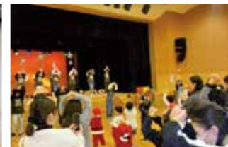
松島ダンス部の皆さんと「パブリカ」を踊りました