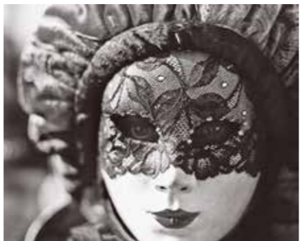
▲ヴェネツィア・カーニバルの仮面

ました。その時代は、病気の原因が悪い空気のせいだと考えられていたためです。また、カーニバルやマルディグラの伝統的な色は、19世紀に紫色、緑色、金色になりました。この色は正義、力、信頼を表します。