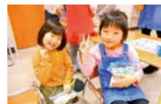
ポップコーンをもらって、ハイ・チーズ