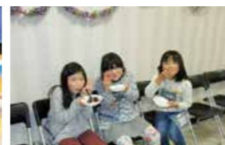
クリスマスケーキ、おいしい!