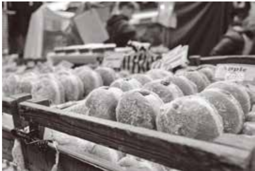
▲ポーランドのドーナツ「ポンチキ」

アメリカでは、クレオール料理や、「ガレット・デ・ロワ」という中にコインの入ったケーキを食べます。コインを見つけた人はその日の王様・女王様です。フランス風の料理以外にも、ポーランドというポーランドのドーナツが一般的になりましたが、1個1000カロリーもあるのでたくさん食べられません。