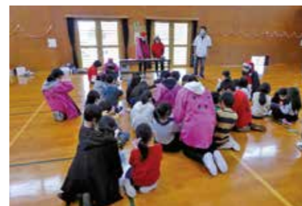
▲みんなでピンゴ大会をしました

ジュニア・リーダー奮闘中! V.O. 34 12月22日、品井沼農村環境改善センターで「まつしま放課後子ども教室三校合同イベント」が開催されました。このイベントは、ジュニア・リーダーが企画から準備、運営までの全てを担当しました。参加した小学生は、ジュニア・リーダーが考えたゲームを楽しんだりピンゴ大会で盛り上がりたりしました。 これまでの研修の成果が発揮されたイベントになりました。今後も、地域の子どものリーダーとして活躍していきます。 ● 問合せ 教育委員会 生涯学習班 ☎354-5714