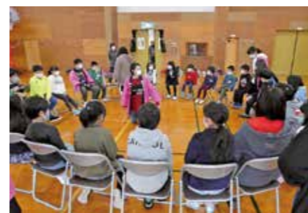
▲「なんでもバスケット」で楽しみました

相手が何に困っているか、何をしたいのかを聞いて、対応してみましょう。色々なパターンが考えられるので、今回示したフレーズ以外もぜひ調べてみてください。