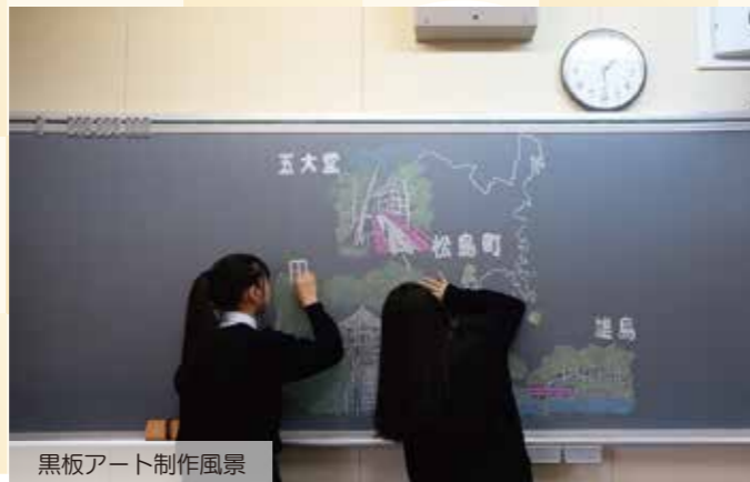
黒板アート制作風景