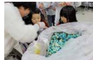
松島ボランティア部の皆さんが大活躍です