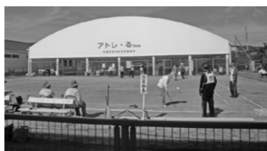
▲ゲートボール活動風景