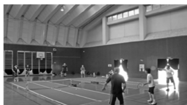
▲バウンドテニス活動風景