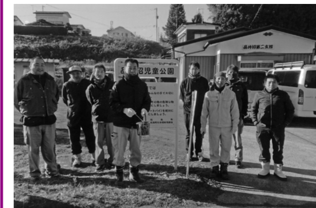
▲ボランティア活動を行った青年部の皆さん

12月15日、松島町職工組合青年部の皆さんが、品井沼児童公園の看板を綺麗に塗装するボランティア活動を実施しました。毎年、青年部の皆さんはいろいろな所でボランティア活動をしています。