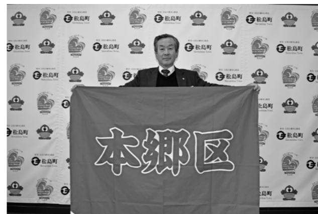
▲寄贈された本郷区の旗

本郷行政区では、寄贈された旗について、今後、機会があることに積極的に使用していきたいとのことでした。