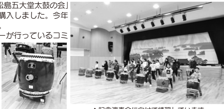
▲記念演奏会に向けて練習しています