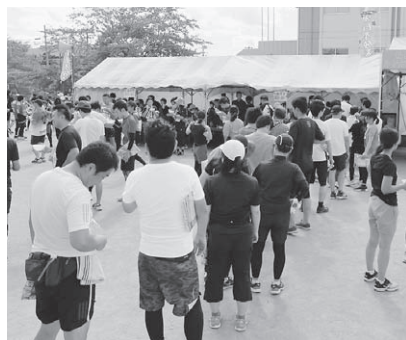
かき汁のお振る舞い

町長 町民の方々が多く参加できるようなシステムを作り、また震災派遣で来てくれたいた職員の方々に声かけしたい。1000キロ縦断リレーマラソンとがあるので、多くの子供たちに参加してもらおうように取り組んでいきたい。オリンピックも活用しながら、できるだけ参加者がふえるように努力していきたい。