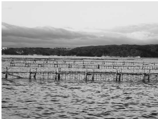
松島湾内にひろがるカキ棚

町長 カキの生産者が減っていることを肌で感じる。若い人たちが受け継ぐうえで、町としてどういうサポートができるか、松島支所などでの話し合いを注視していきたい。