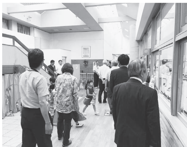
視察調査 兵庫県福崎町