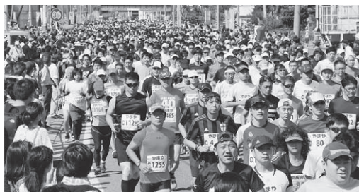
昨年のハーフマラソン大会

町長 松島町と東松島市でやってきた経緯があり、通行止め時間帯もあるので、関係自治体、放送会社等と考えなくてはならない。