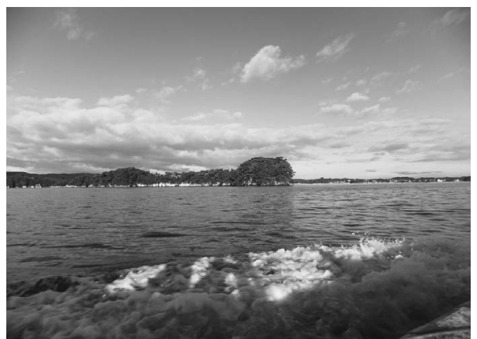
牡蠣を収穫し、漁港へ

問 大事なことは地元の漁業者が地元できちんと漁業が営めて、地域経済に貢献できるようにすること。地域経済の担い手として位置づけ、小規模家族漁業を町としてどう応援するのか、新規就業支援などの施策など必要と思うがどうか。