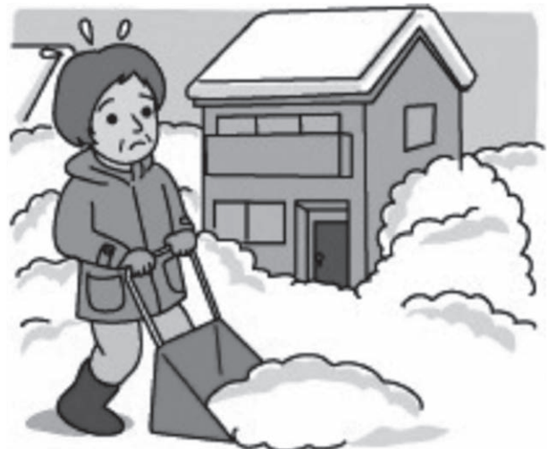
雪かきをする住民

問 小石浜地区には50世帯くらいの方が居住している。高齢者の方が多く、降雪時の除雪が大変であると聞いている。人と機械をかりつけた形で「モデル地区」として除雪対策を考えるべきであるかどうか。