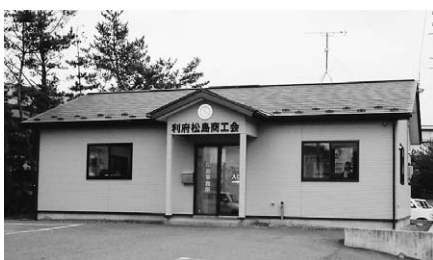
利府松島商工会松島事務所

産業観光課長 産業観光課から当初予算要求を行い、財務課とのヒアリングをもとに、前年度の実績、今後の事業展開等を含め、当初予算編成において予算案が確定していく流れになっている。