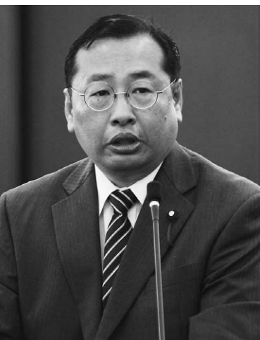
さくら い やすし 櫻井 靖 議員