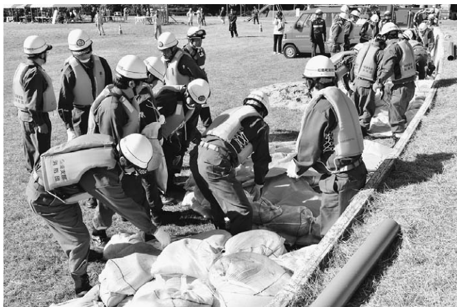
11月4日 松島町総合防災訓練