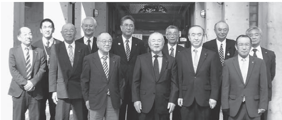
にかほ市議会を視察

にかほ市は議会活性化やICT化に向け一環した取り組みを行っている。本町としても参考にしながらよりよい議会運営を行って行きたい。