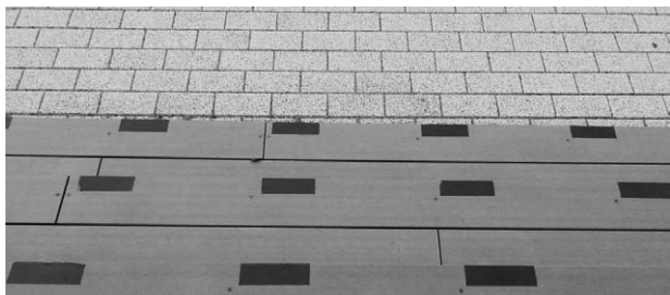
段差のわかりづらい階段

今後も利用者の意見を聞きながら総合的に判断・対処していく。 町長 国の検査が全て終わって、新たな施設展開に切りかえるとき、今日の意見等は参考にして、さまざま面で改良をしていきたい。