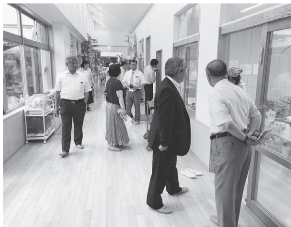
視察調査 香川県綾川町

松島町では、幼児保育施設の老朽化や保育士不足など、早期の解決策が望まれているため、町当局より3回にわたる聞き取りと県内2ヶ所、県外3ヶ所の先進地視察を実施し、協議を行い、町当局に対し、次の通り提案した。 ①一時的な対策ではなく、将来を見据えた既存施設の改築および新設を強く望む。 ②保育所の集約について、保育対象の保護者のみならず、地域の人たち