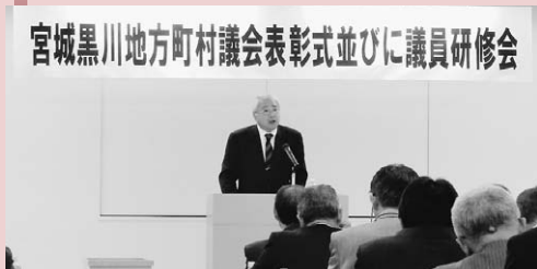
宮城黒川地方町村議会議員研修会