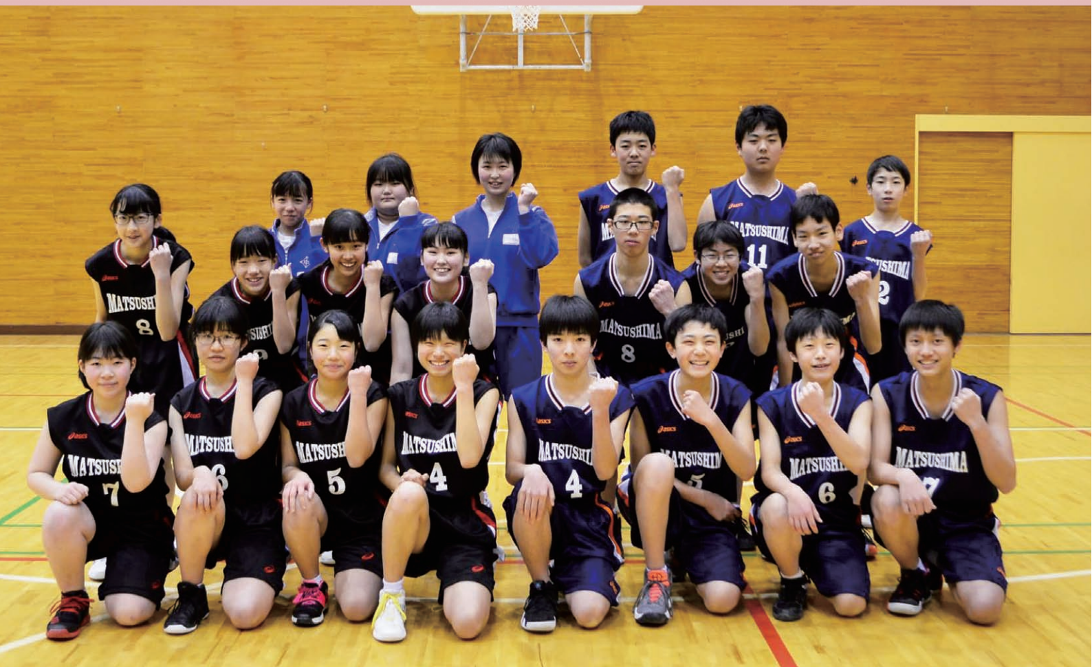
仲間と励まし合い、誇りをもって戦いたい（松島中学校バスケットボール部）