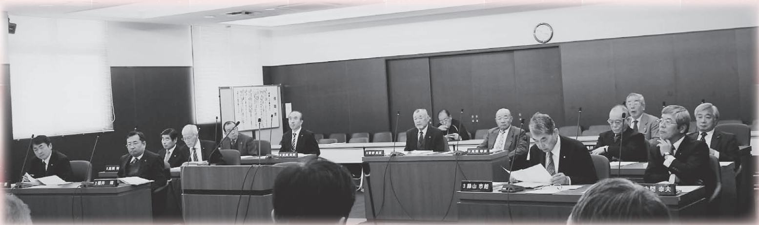
12月定例会議案審議の様子