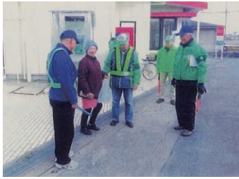
高城地区安全・安心パトロール

巡回は、暑い日や雪の日もあり、突然の冷たい雨や厳しい寒い日もあり身体にこたえます。