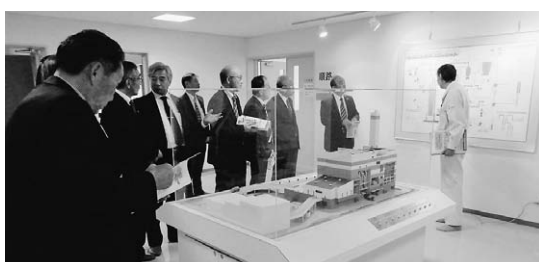
盛岡紫波地区環境施設組合を視察