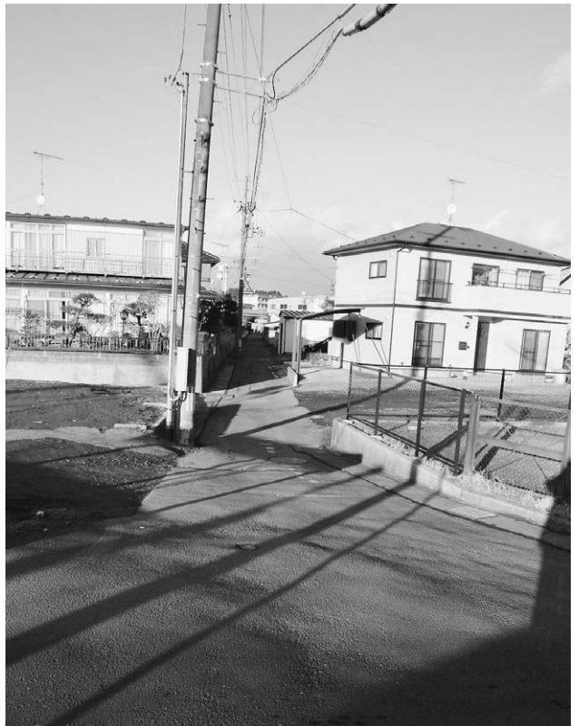
雨水管渠築造工事をする高城地区

水道事業所長 工事は分けて施工する計画であり、全区間の通行止めにはならない。区域内に駐車場を持っている方には、誘導できる体制をとっていきたい。