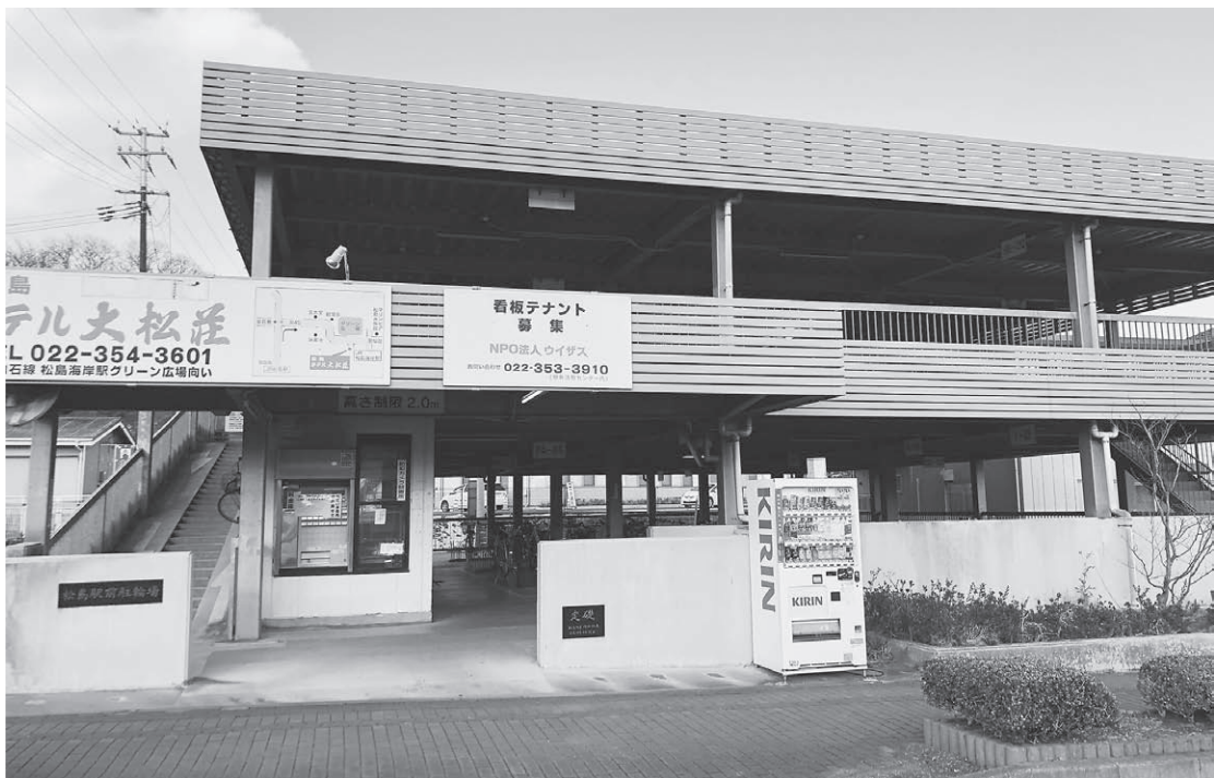
改修される松島駅前駐輪場

建設課長 管理人は朝2時間、夕方2時間の4時間勤務である。防犯カメラも設置している。損害賠償義務については、町では負わない。