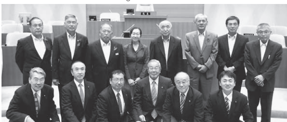
滑川町議会との意見交換

今回の視察では、「なめがわ議会だより」の編集方法、発行までのスケジュール等についての説明があり、その後意見交換を行った。特に印象的だったのは、滑川町議会